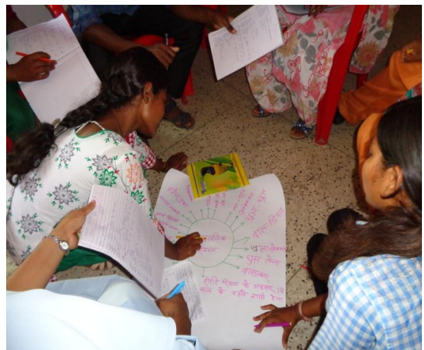
Adolescents en session au Centre de Formation de Vikas Bharti, Jamshedpur